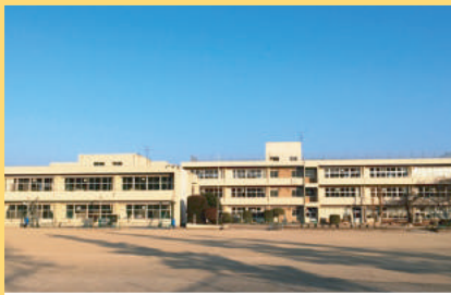
安中市立磯部小学校 300m