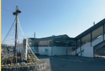
JR 磯部駅 1,500m