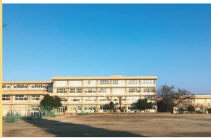
安中市立第二中学校 1,800m