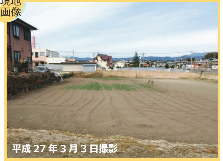
平成 27 年 3 月 3 日撮影