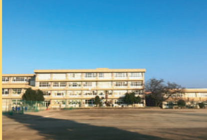
安中市立第二中学校 950m