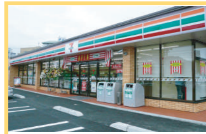
セブンイレブンけやき通り店 140m