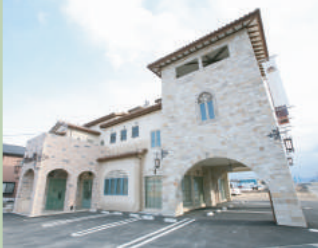
弊社外観 (火曜定休) (打ち合わせルーム多数有り)