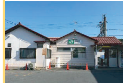
JR 井野駅 700m