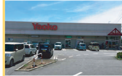
ヤオコー高崎井野店 1,300m